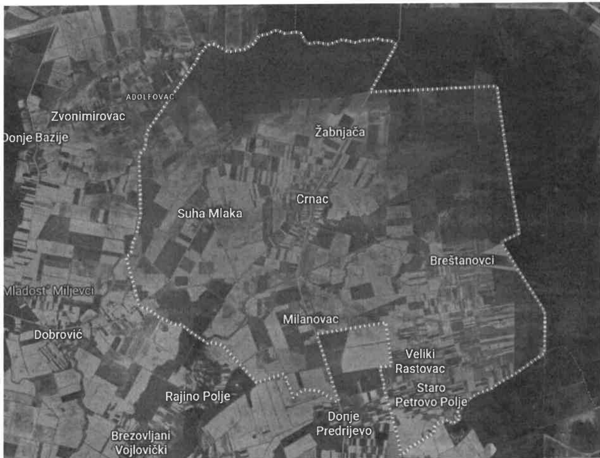
Slika 1: geografski položaj Općine Crnac

Općina je smještena u Virovitičko-podravskoj županiji i ukupne je površine 79,4 km 2 . Prema popisu stanovništva iz 2021. godine broji 1.116 stanovnika. Općina spada u red manjih općina površinom i brojem stanovnika u Virovitičko-podravskoj županiji. Općina obuhvaća ukupno deset naselja: Breštanovci, Crnac, Krivaja Pustara, Mali Rastovac, Milanovac, Novo Petrovo Selo, Staro Petrovo Selo, Suha Mlaka, Veliki Rastovac i Žabnjača. Najveće naselje je Crnac s 407 stanovnika. Općina graniči sa sjeverne i istočne strane s Osmječko-baranjskom županijom, sa zapadne strane s općinama Čađavica i Nova Bukovica, a s južne strane s općinama Čačinci i Zdenci.